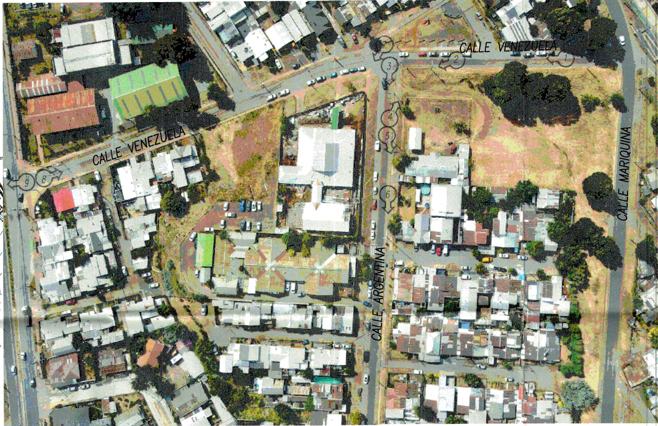
VISTA AÉREA DE CESFAM VILLA ALEGRE